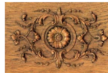
Extrait de boiserie L.XIV

Prolongement de la formation vers une maîtrise du métier de sculpteur.