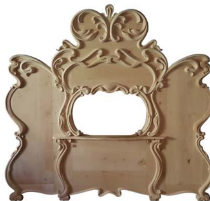
Façade Orgue Limonaire - Art Nouveau