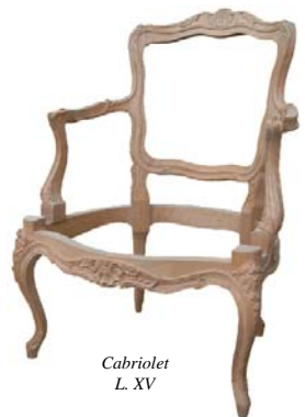
Cabriolet L. XV