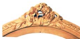
Fronton de fauteuil L.XIV