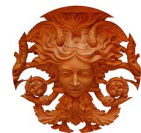
Extrait de console L.XVI